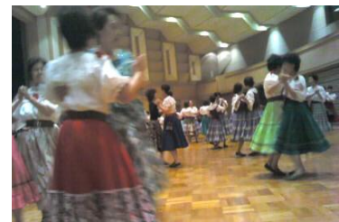
61周年パーティー風景